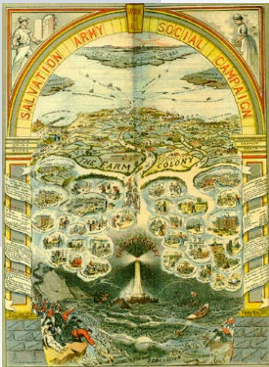
Le programme social de l'armée du Salut (1890)

Dernière allocution publique de William Booth au Royal Albert Hall, à Londres, le 9 mai 1912.