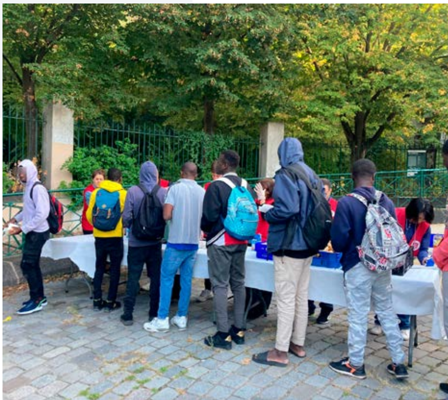
Distribution alimentaire dans un parc parisien.

Pour autant, les inquiétudes demeurent. C'est le cas, par exemple, de la « Halte