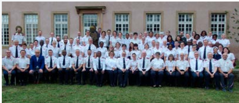
Les officiers Français, Belges et Suisses francophones réunis

Les conseils d'Officiers 2024 se sont tenus du lundi 29 janvier au jeudi 1er février 2024 au Centre Culturel Saint Thomas à Strasbourg.