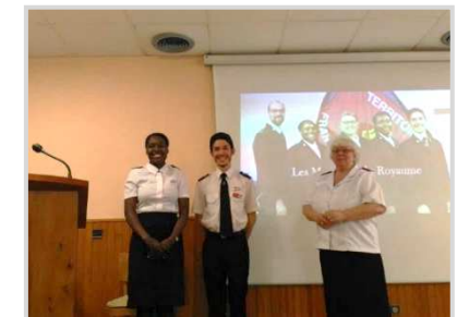
Ligue du foyer au poste