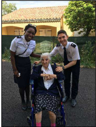
Visite à la Major Boyadjian