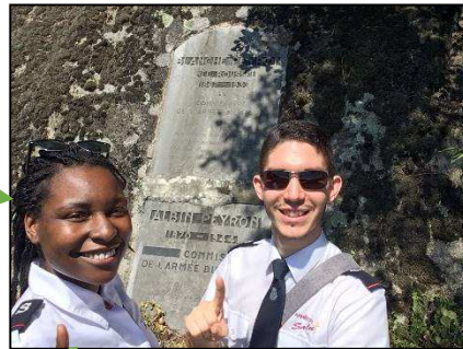
Visites du Bouchet de Pransles