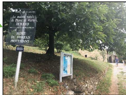
Visite du Mémorial de la résistance