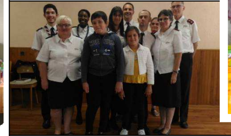
Compte rendu des camps d'été