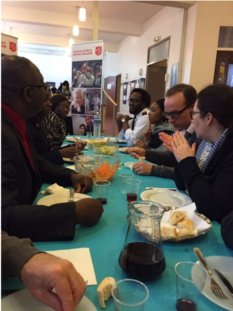
Le Chœur des filles déjeunant avec le Pasteur et le président de l'Entraide protestante de l'EPUF de Saint-Maur-des-Fossés le dimanche 24 novembre 2019