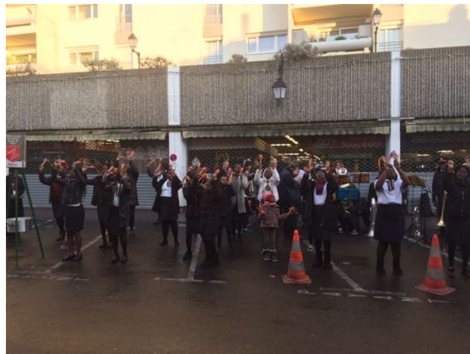
La fanfare et les tambourins en plein-air à St Maur des fossés