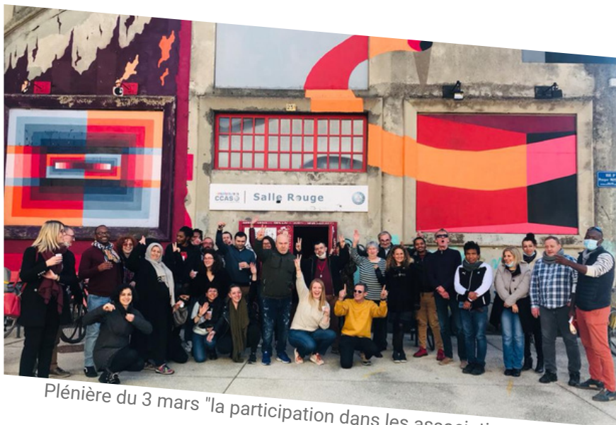
Plénière du 3 mars "la participation dans les associations" à Grenoble

Représente les personnes en situation de précarité ou l'ayant été dans les instances de pilotage, suivi et évaluation des politiques d'accueil, hébergement et insertion