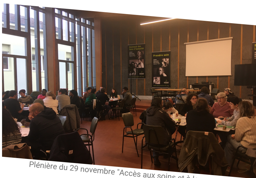
Plénière du 29 novembre "Accès aux soins et à la santé" à Valence

Le compte-rendu de cette journée est disponible sur demande !