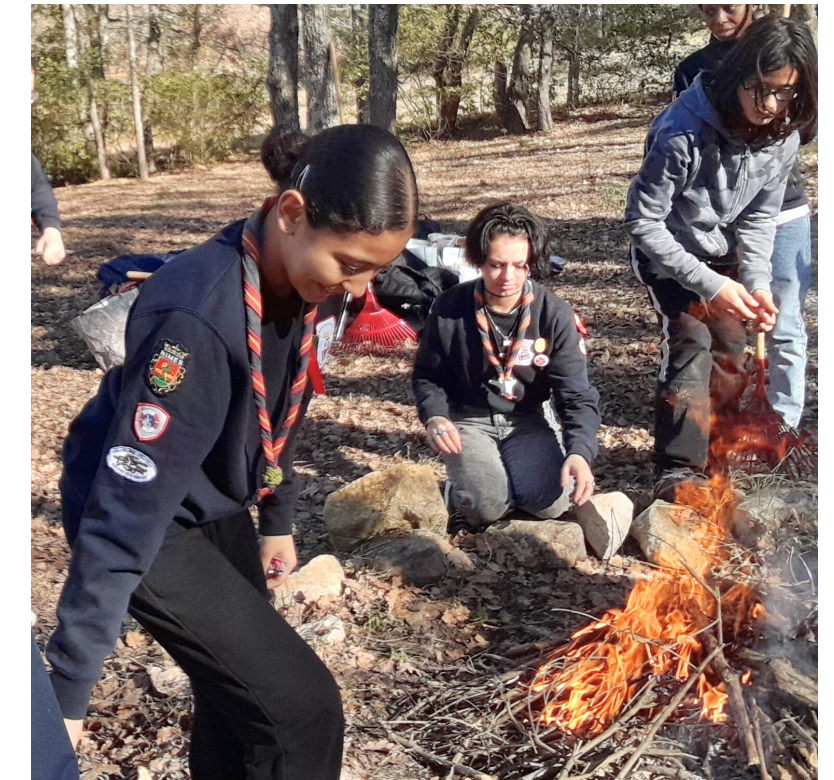
Alimentation de notre feu !