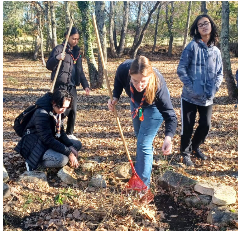
Préparation du terrain et lancement du feu

Le samedi 3 février les PF sont allés passer la journée à Castelnau-Valence. Au programme : feu, pain perdu au feu de bois, permis couteau, et mise en place du scénario de notre escape game !