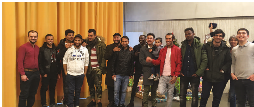
Noël avec les personnes accueillies

Il s'agit de couples avec enfants souvent de grande composition familiale (de 4 à plus de 7 enfants) et plus rarement, des familles monoparentales. En 2019, 45% des accueillies sont des personnes seules.