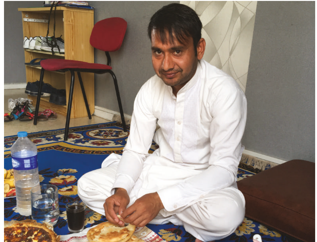
Repas chez une personne accompagnées