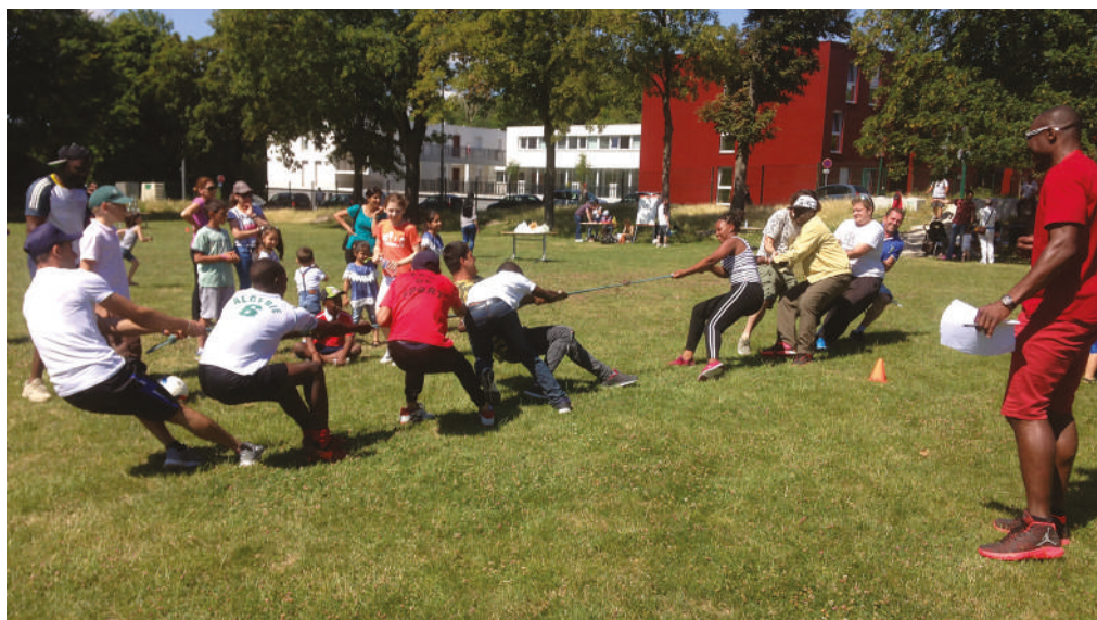
Olympiades avec les personnes accueillies