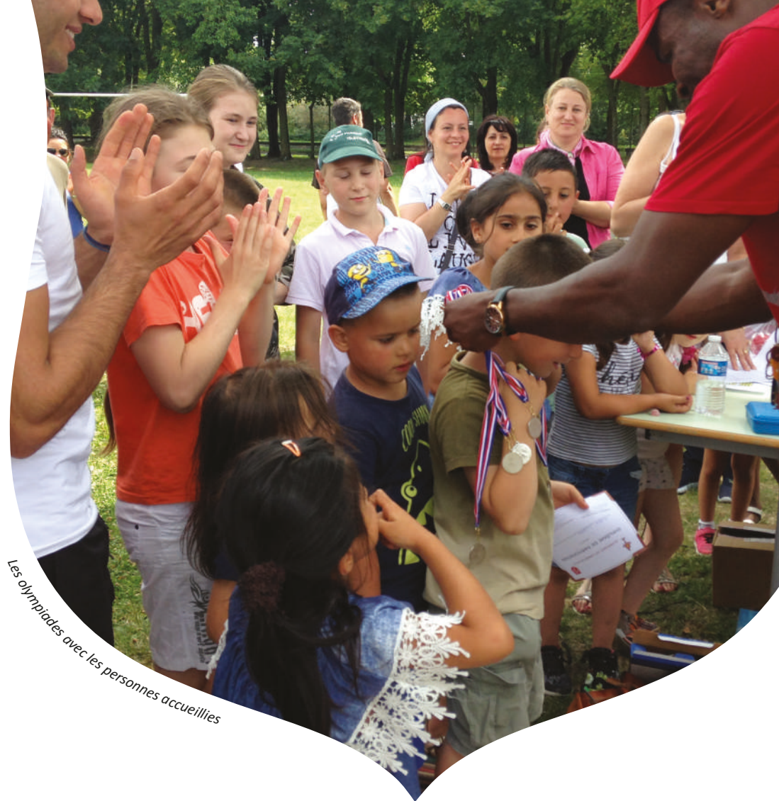
Les olympiades avec les personnes accueillies