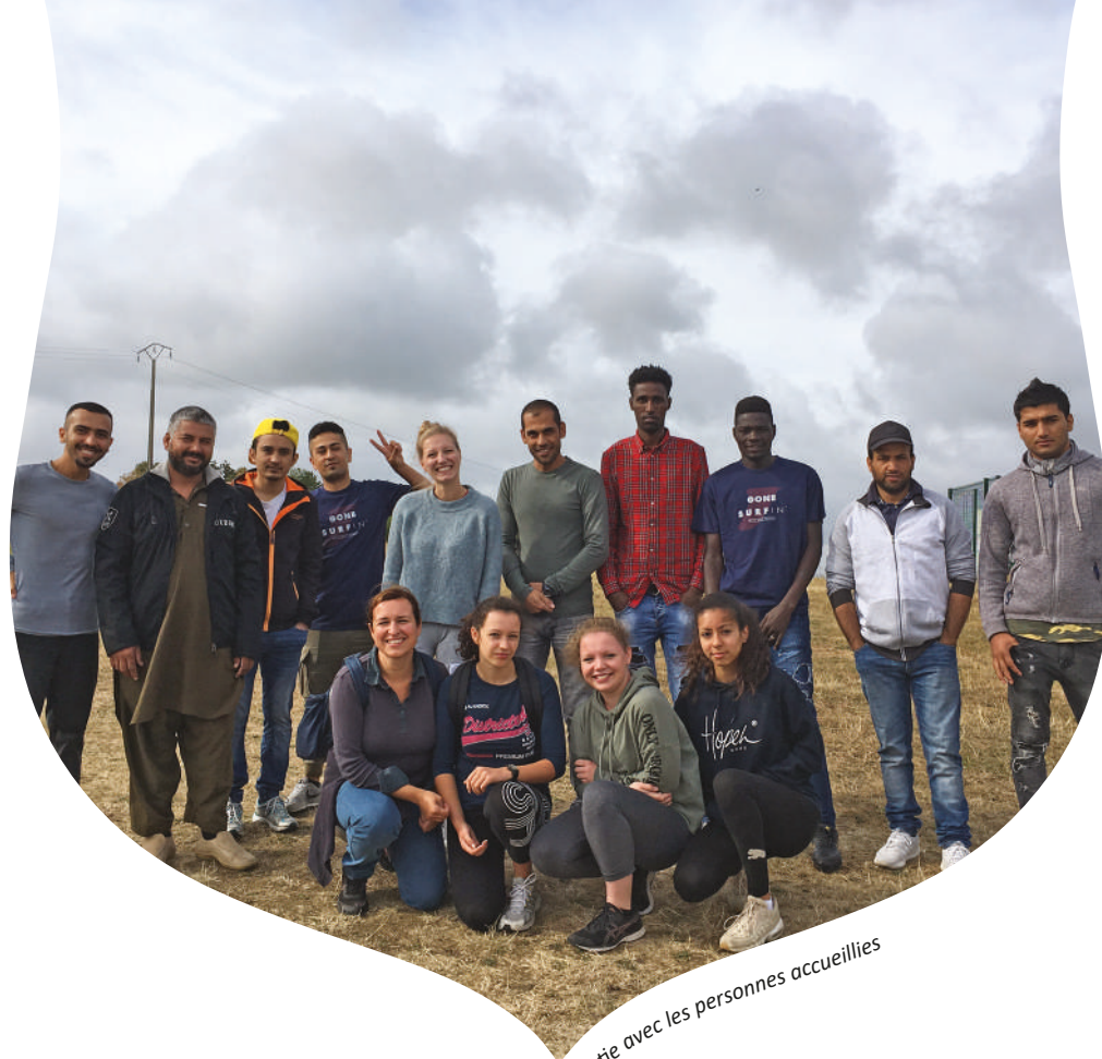
Sortie avec les personnes accueillies