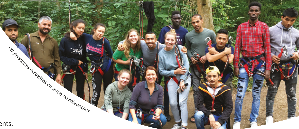
Les personnes accueillies en sortie accrobranches