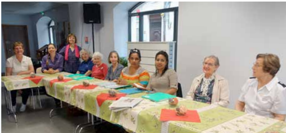
Un petit déjeuner ponctué de chants, de prière et de discussions

À la fin de la dernière séance, une soldate - convaincue de l'importance d'être enseignée plus en profondeur sur les dons afin de