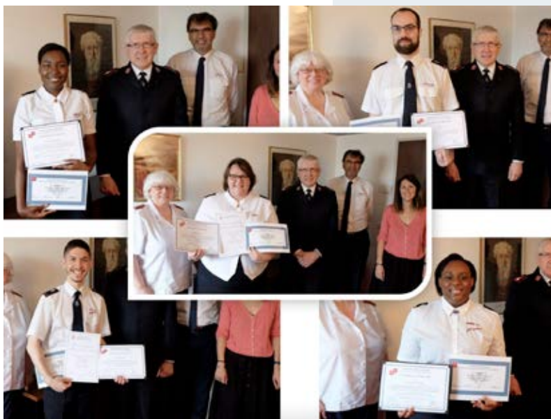
Remise des diplômes et certificats de la Formation

Une vidéo souvenir à usage familial est disponible sur demande à