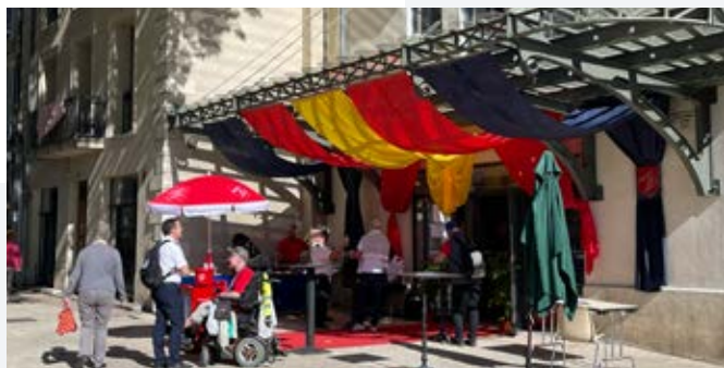
Le poste de Nîmes en fête sur le boulevard Victor Hugo

Fin 1981, une radio locale chrétienne, Radio Alliance, est créée en collaboration avec d'autres églises nîmoises. À l'époque, c'est un