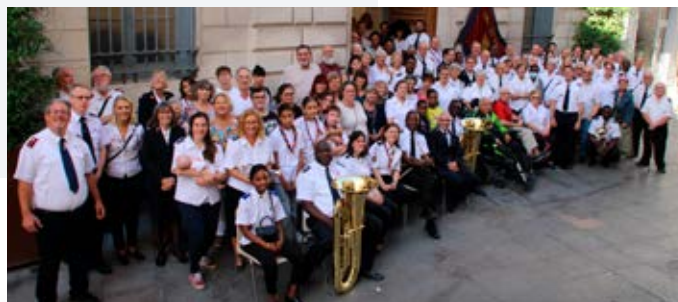
Photo prise à l'issue du culte du dimanche matin qui a réuni une centaine de personnes rue Régale

Une exposition retraçant les 140 ans de l'Armée du Salut à Nîmes a été inaugurée en présence de l'adjoint au Maire de la Ville. L'exposition reste ouverte pendant deux semaines au boulevard Victor Hugo, juste à côté des Arènes. Là encore, de nombreux passants de cet axe très