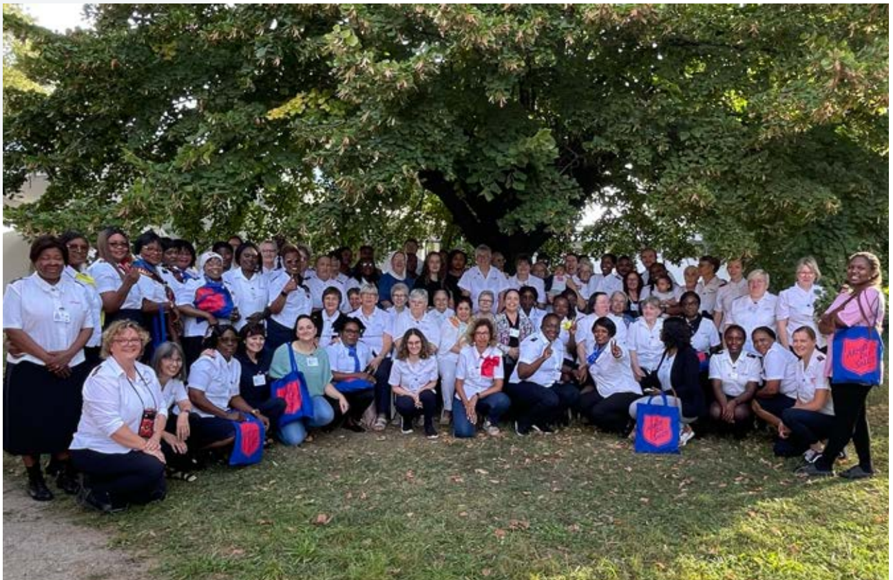
Photo souvenir du week-end des Ministères Féminins et Familles