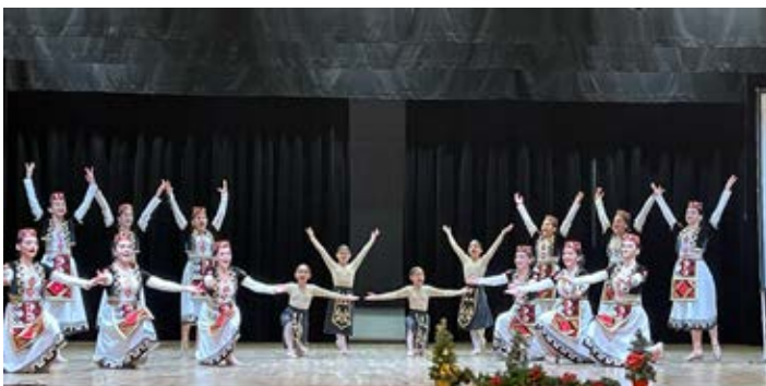
Un groupe de danses arméniennes a animé la fête du poste

Les festivités démarrent par une animation proposée par une équipe du poste à la Fondation protestante Sonnenhof auprès de personnes en situation de handicap.